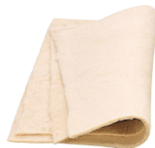
S-2025 1枚 45×50cm