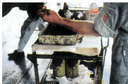
ブレーキドラム・ベアリング交換の油受け