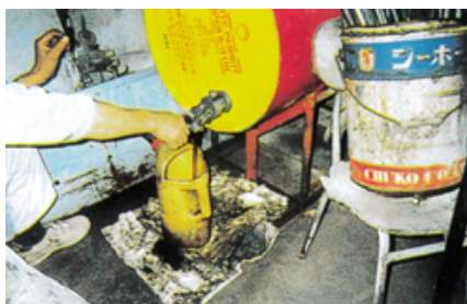
エンジンオイル小出し器