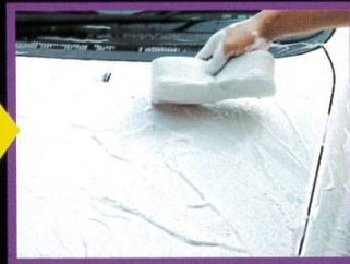
⑤スポンジで拭いて水アカも除去。水で洗い流して仕上げる。