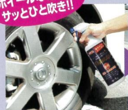
鉄粉落としを吹きつけます。