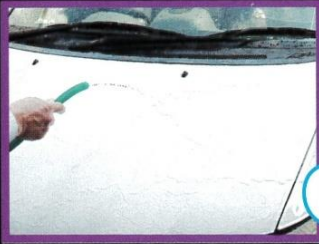
①水をかけて、ボディを冷やす。