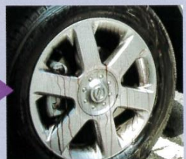
鉄粉が液と反応して紫色に。