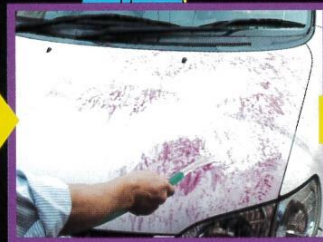
④再度水をかけ軽く洗い流す。